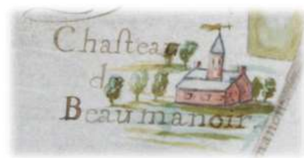
A.D.59 - 56 Fi 162