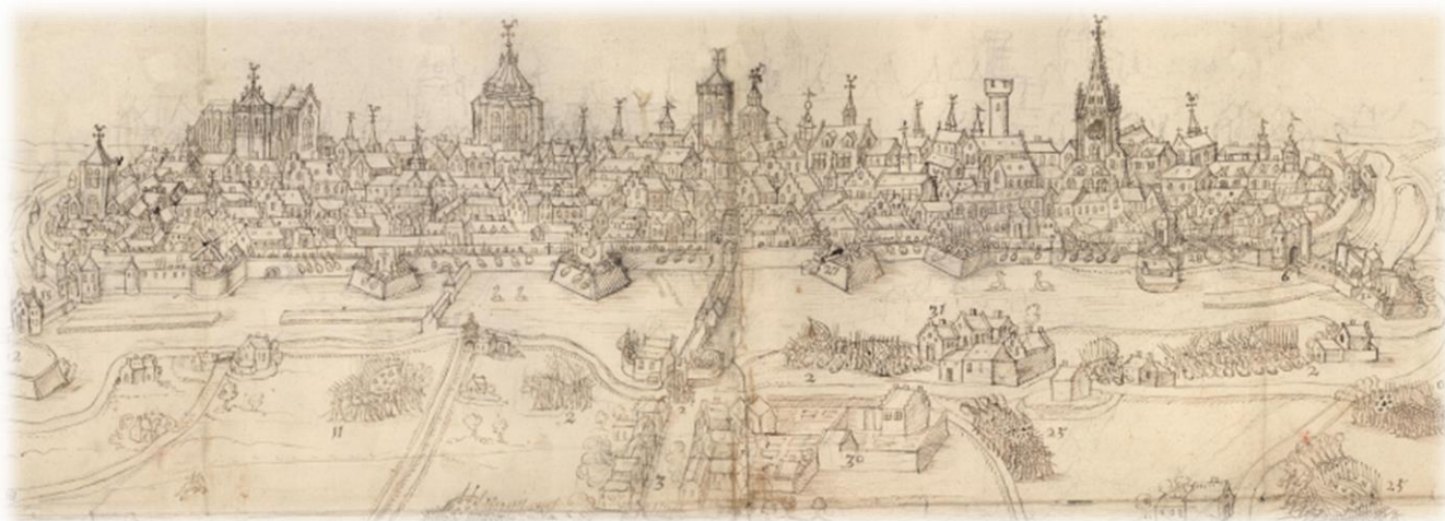
Lille assiégée par les Français - 1641